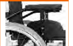
apoia braços reg. em altura