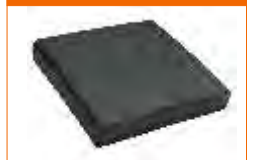
almofada soft seat 70mm em PU