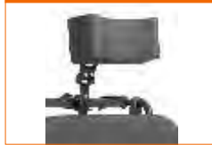
encosto de cabeça em U