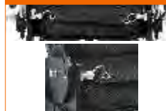
costas reclináveis (mecânico)