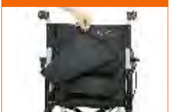
encosto c/ regulação tensão parcial