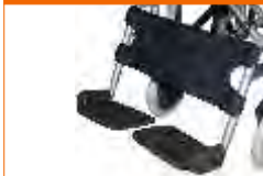
suporte de gêmeos