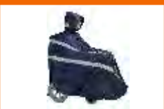
capa de chuva