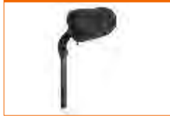
encosto de cabeça de abas