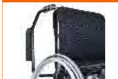
apoia braço rebatível simples