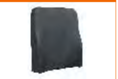
almofada comfort back suporte lateral