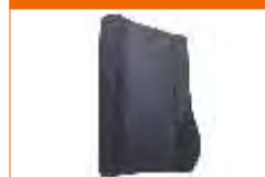
almofada soft back suporte lombar