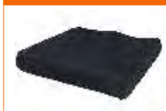
almofada soft seat 70mm em 3D