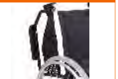
apoia braço rebatível completo