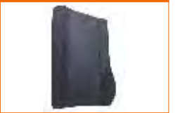
almofada comfort back suporte lombar