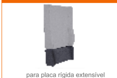
almofada comfort back extensão 200mm