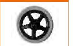
rodas dianteiras maciças