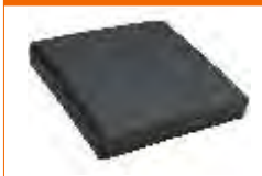
almofada comfort seat 60mm em PU