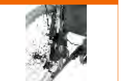
costas reclináveis (bomb gás)