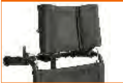
encosto de cabeça simples