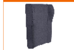
almofada comfort back suporte ombros